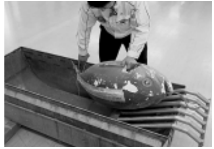
グレーズタンクから「気仙沼スロープ」を伝ってマグロを滑り上げる

東日本の支援を離れ、独自に改善活動を進めていきます。このタイミングで当初の目的に立ち返り、自動化を含めた省力化に加え、「定着率向上」も大きな柱として考えることにしました。